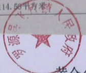
黄金金建房用地平面图