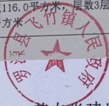
黄专炎建房用地平面图